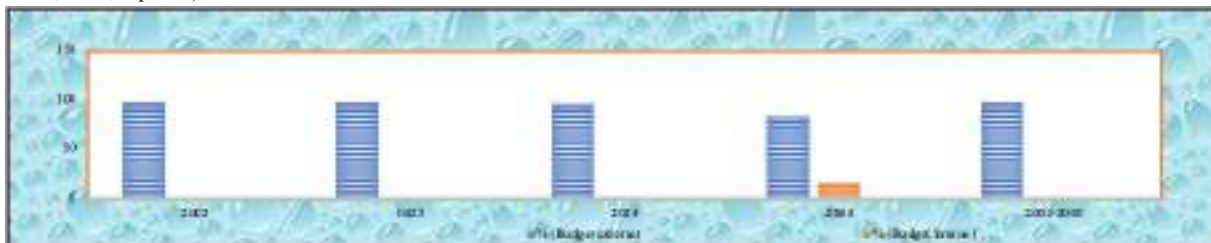
Graphique n° 1 : La part des budgets interne et externe dans le budget total du ministère de la Santé

À partir du tableau n° 3 et du graphique n° 1, il apparaît que l'apport extérieur est largement représenté dans le budget du ministère de la Santé avec 98,25 % contre 1,74 % pour le budget intérieur. Cette situation confirme le rôle considérable de l'aide internationale pour la construction des politiques sociales au Congo (Fouilleux, 2015). Au regard de ce que nous venons de démontrer dans le domaine de la santé, il convient de retenir que les décisions, notamment les allocations budgétaires obtenues par le Congo, grâce à des coalitions entre l'État congolais et les bailleurs de fonds internationaux, ont permis la mise en place de mécanismes de